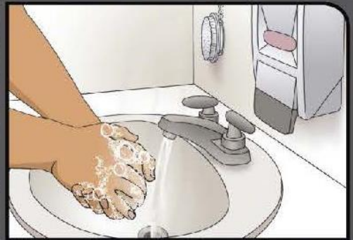
Wash and scrub for 20 seconds Frote sus manos por 20 segundos