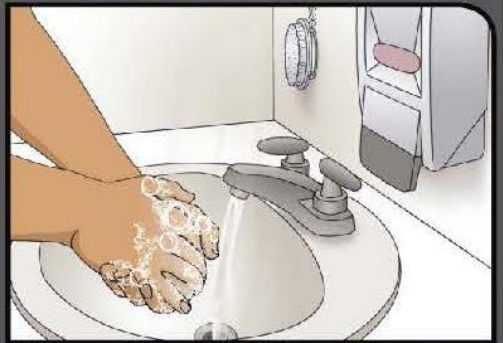
Wash and scrub for 20 seconds Frote sus manos por 20 segundos