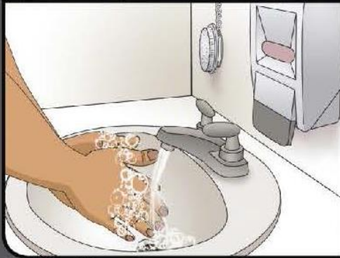
Rinse off soap Enjuague