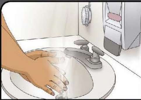
Wet hands with hot water Moje sus manos con agua caliente

WASHOE COUNTY HEALTH DISTRICT ENHANCING QUALITY OF LIFE