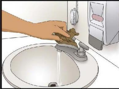
Turn off water with paper towel Cierre la llave del agua usando una toalla de papel