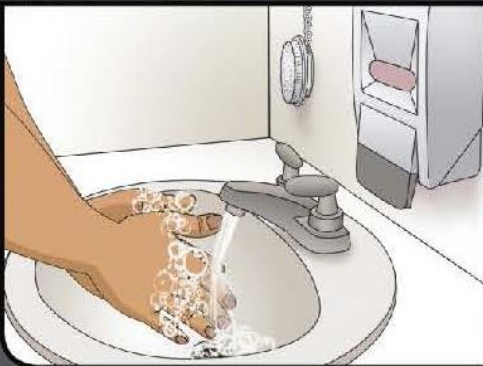
Rinse off soap Enjuague