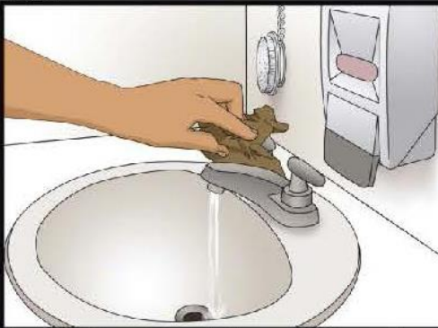
Turn off water with paper towel Cierre la llave del agua usando una toalla de papel